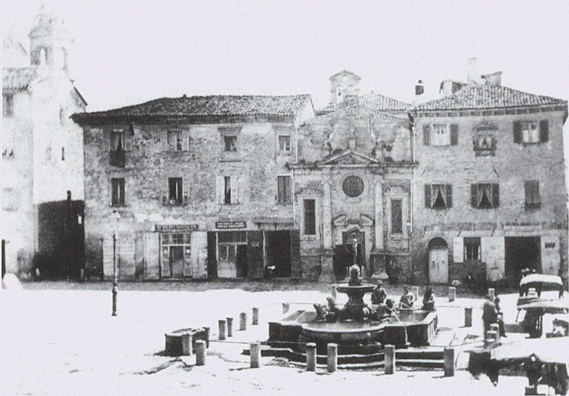
Scorcio di Piazza XX Settembre con la Chiesa di S. Silvestro in una foto risalente alla fine del secolo XIX.

Scultura di mano che benedice trovata nella parete dell' abate maggiore di S. Silvestro in Piazza